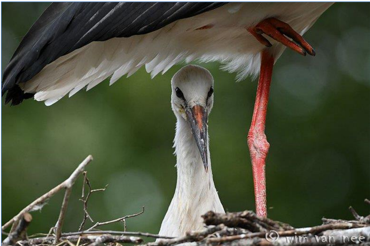
De eerste sporen van oranje zijn zichtbaar.