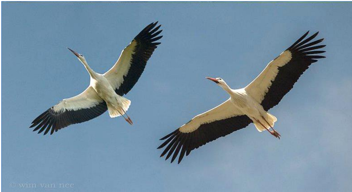
Jong en volwassen naast elkaar. Zoek de verschillen.