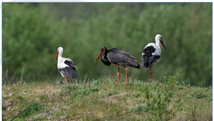
Erica, 2 mei 2020

Link naar artikel: Sensation in Lüder: Zwei 'Graustörche' geboren