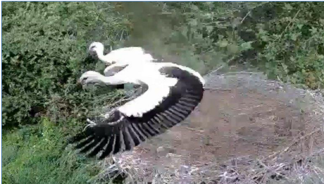
Screenshot van het moment van uitvliegen 04-07-2023

Ik eindigde mijn blog van gisteren met de hoop dat alles goed zou gaan. En vlak daarna vervloog die hoop omdat een visser zich onder het nest installeerde en een 5 meter lange hengel omhoog stak. Dat gevaar kwam te dichtbij. De ooievaarsjongen gingen op de vlucht, zoals Pa en Ma dan ook zouden doen.