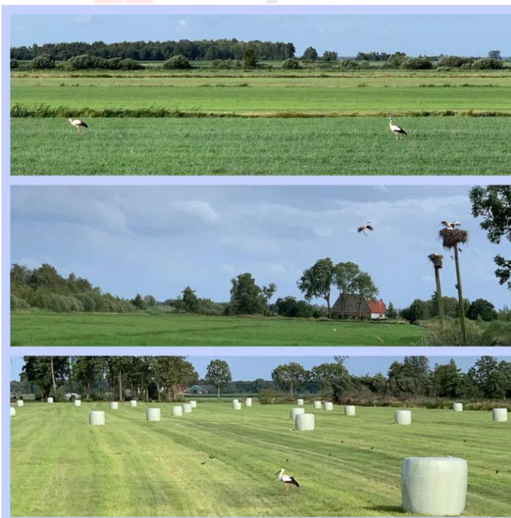
Buurtooievaars Rottige Meente 16-07-2023

Het is zover. Deze week sluiten we het Beleef de Lente broedseizoen van de ooievaars af. Het nest is abrupt verlaten. Maar in de Rottige Meente zijn nog volop nesten met jongen te zien die binnenkort uitvliegen en in groepen vertrekken. Daarna verstilt ook langzaam het geklepper van de ouders.