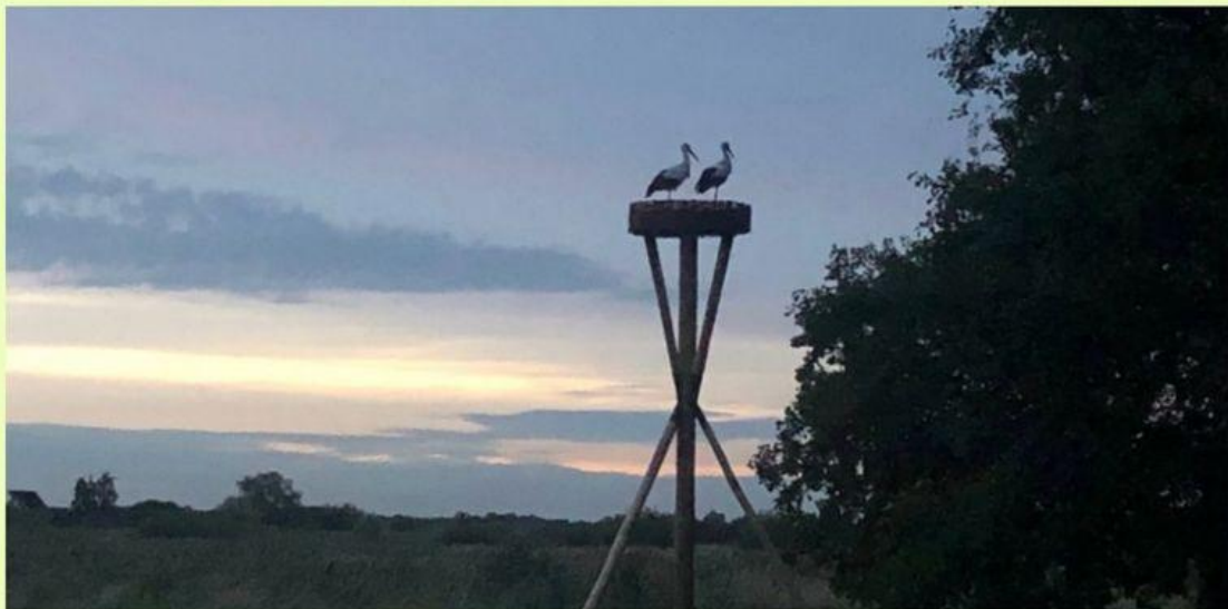
Omgewaaid buurnest met slachtoffer (5 juli 2023) en het nieuwe nest: zie verslag onder 'Helaas ook hier'