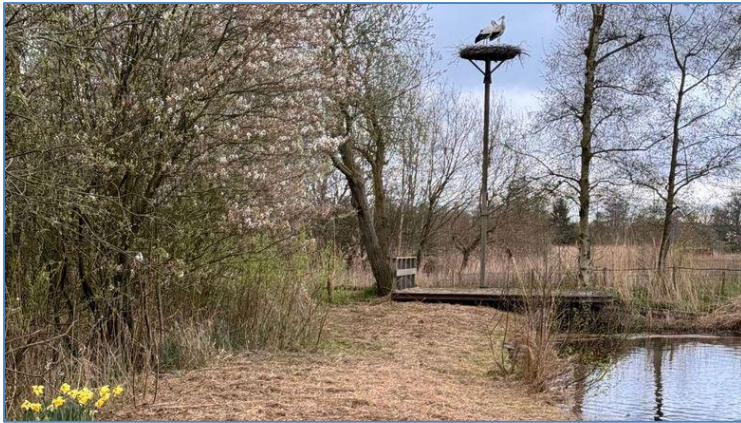
Ooievaarspad gemaaid voor Pa en Ma2 (2 april 2024)

Er landt een ooievaar op het nest. En even later nog één. Zomaar een man en een vrouw? Of Pa en Ma? Want dan zijn het bekenden. Door Beleef de Lente gaan we vogels van elkaar onderscheiden. Het worden individuen en we leven met ze mee. We herkennen in de vogels misschien ook iets van onszelf.