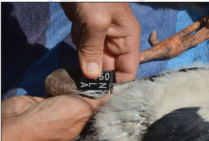
Eén van de jongen in Ankeveen krijgt een ring

Ons wordt wel eens gevraagd waarom ooievaars geringd worden. De afgelopen weken hebben daar hopelijk deels al antwoord op gegeven. Door het ringen worden ooievaars individueel herkenbaar, waardoor het mogelijk is ze te volgen. Onmisbaar voor onderzoek.