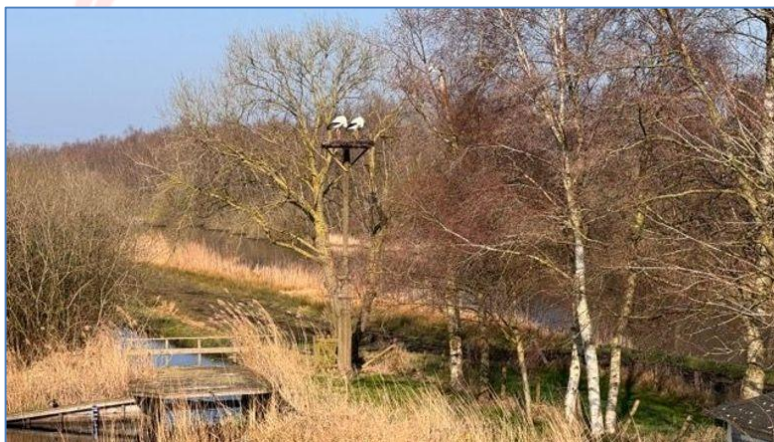
Pa en VV2 zijn al een setje op het nest (8 maart 2024, foto Titia Bijwaard)

Zou het dan toch zo zijn? Is het deze ooievaarsjongedame gelukt om het hart van Pa te veroveren en de herinnering aan Ma te laten verbleken? Wordt deze lieflijke 'Vreemde Vrouw 2' de nieuwe 'Ma 2' ?