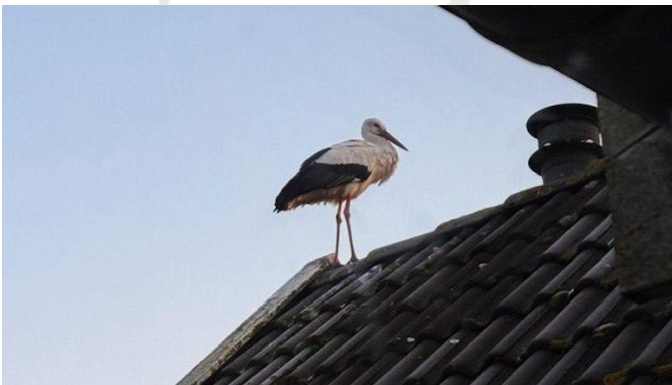
VV2 op dak 08-03-2024

Op dit ooievaarsnest heeft, sinds hier voor het eerst werd gebroed in 2013, slechts één vrouw de lakens uitgedeeld: Ma! Ook nu was ze als eerste terug en met Pa erbij leek alles klaar voor hun tiende broedseizoen samen. Toch zien we Pa nu met een Vreemde Vrouw. Nummer 2 zelfs al. Hoe zit dat?