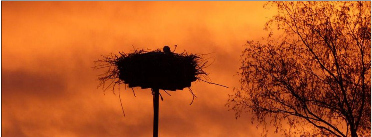
Saharazand boven het nest in Ankeveen