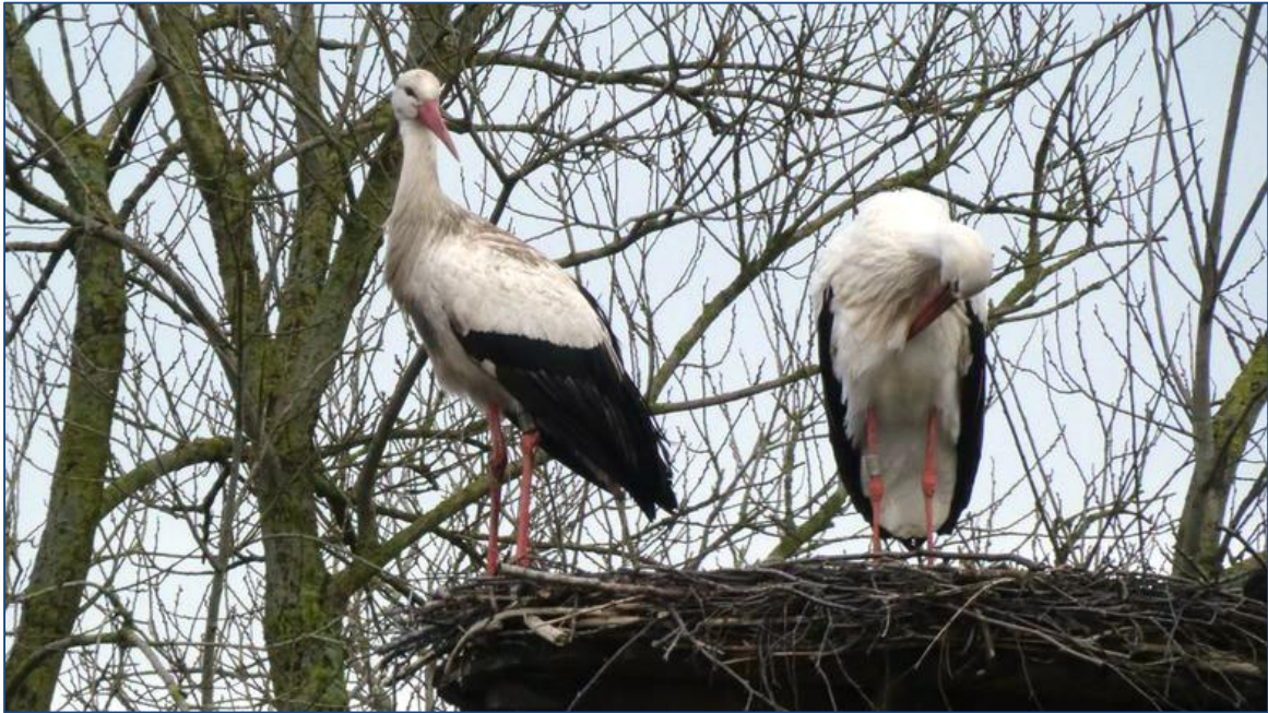
Een Nieuwe lente voor Pa en Ma ooievaar 24 februari 2024