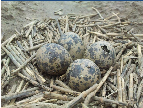
nest van kievit

We zullen door de webcam op de minuut nauwkeurig kunnen volgen wanneer het eerste ei wordt gelegd. De ervaring van de afgelopen jaren leert, dat de meeste vrouwtjes hun eieren laat op de avond, heel vroeg in de morgen leggen. Zou VV2 ook rond die tijd leggen? Ik ben benieuwd.