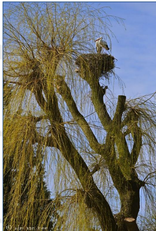
Elburg, 9 maart 2024

Het gebied waar ooievaars worden gezien, wordt in de wintertijd groter. Trekkende ooievaars uit ons land verleggen hun terrein naar het zuiden van Europa of West-Afrika. Oostelijk trekkende ooievaars kunnen via de Bosporus zelfs het zuiden van Afrika bereiken. Over de trek is ook veel te vertellen. Hoe weten de ooievaars waar ze heen moeten en hoe vinden ze hun route? En waarom gaat de één veel verder dan de ander of gaan sommige ooievaars zelfs helemaal niet weg?