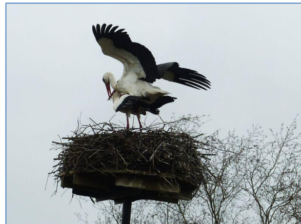
Het begint met de paring

De ontwikkeling van het ei is een ingewikkeld proces met veel opeenvolgende stapjes, waarbij allerlei lagen en vliezen worden toegevoegd, met als laatste de kalkschaal. Ook weer onder invloed van allerlei hormonen. Vanaf het moment dat de zaadcel de eicel heeft bevrucht duurt het bij ooievaars ongeveer twee dagen tot het ei helemaal klaar is om gelegd te worden. Bij allerlei (kleinere) vogels duurt het vaak maar 24 uur; zij leggen elke dag een ei.