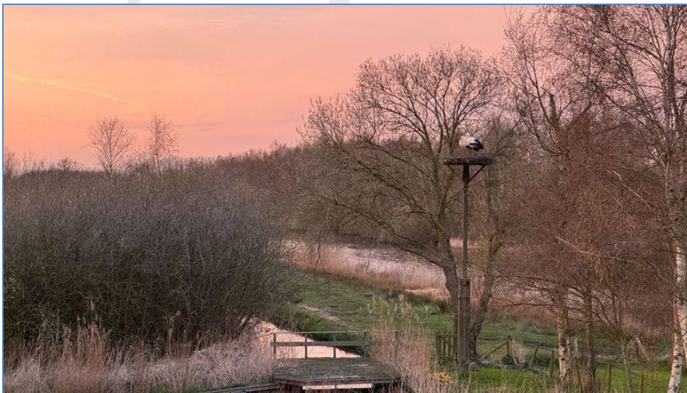
Pa en VV2 bij zonsondergang (27 maart 2024)

Wat een drukte was het deze start van het seizoen rondom ons ooievaarsnest! Pa, zijn concurrenten en zijn vrouwen vlogen af en aan. Sinds een paar dagen is de rust weergekeerd. Pa en VV2 verkeren nog steeds in hogere sferen, maar zijn inmiddels wel 'geland' op het nest.