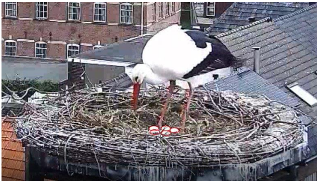
Foto Leo: Screenshot van de 5 eieren, voor de duidelijkheid heb ik ze even omljnd, 5 stuks dus en redelijk goed verstopd en het is nog niet eens Pasen