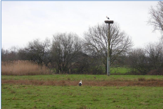
Pa Beugen op het nest en vreemde ooievaar in het weiland onder het nest