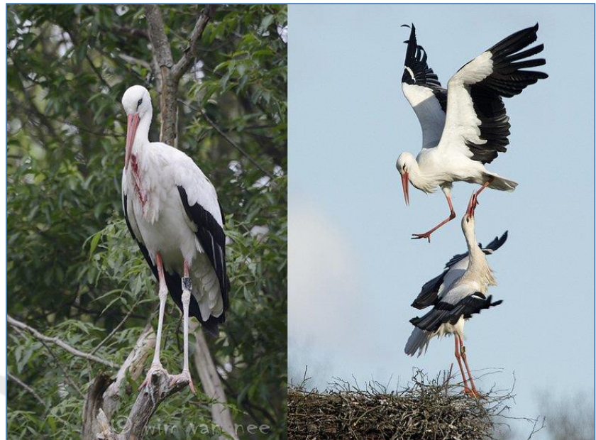
Bij de poot genomen en tot bloedens toe verwond