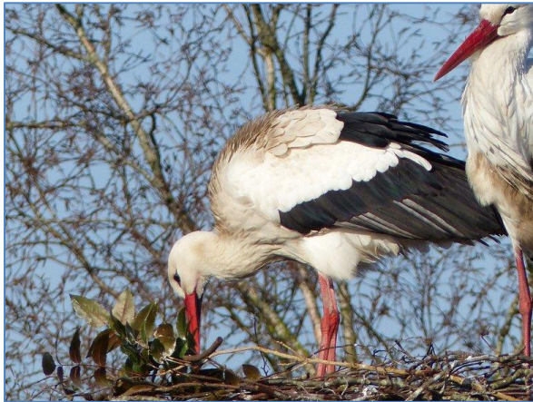
Vieze buik.

Maar op veel nesten ontbreken de ringen aan de poten. Wie is dan wie, wie is de man, wie is de vrouw? Duidelijk op het moment dat ze paren, maar daarna.....? Het verschil is eigenlijk niet te zien.