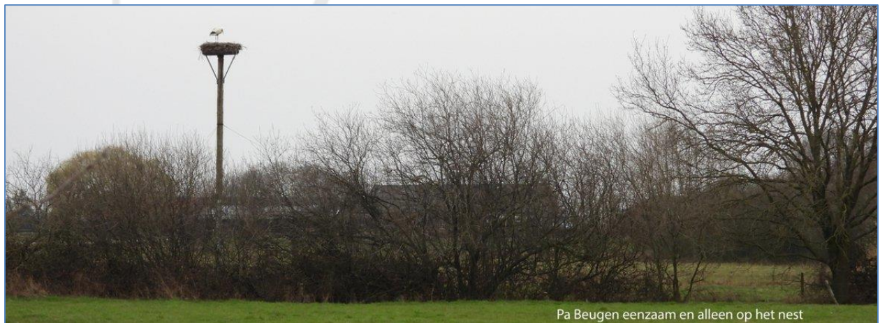
Pa Beugen eenzaam en alleen op het nest