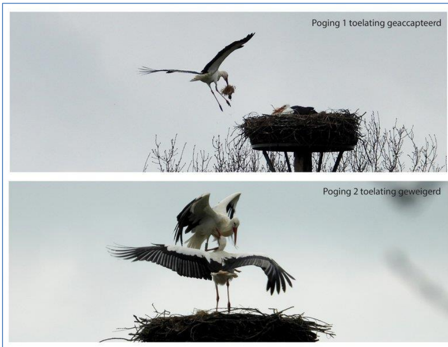
Het vreemde vrouwtje werd de eerste keer toegelaten en bij poging twee werd ze verjagen door Pa Beugen. Wordt vervolgd.