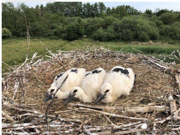
Natuurgebied de Vilt in Beugen drie kuikens op het nest in 2019 en eentje dus met twee zwarte