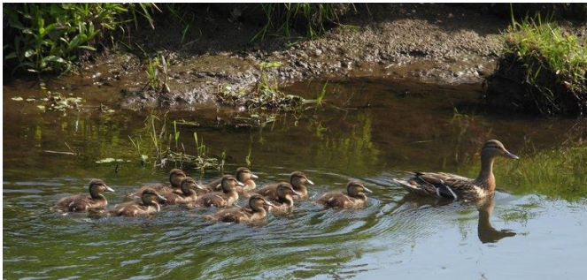
Ma wilde eend komt parmantig haar kroost van 10 stuks even laten zien.