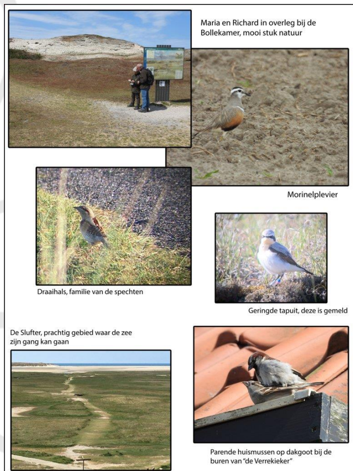
Collage van Texel, sommige foto's zijn ver weg en door telescoop genomen en dus wat minder duidelijk.