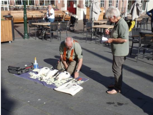
Ja dat is heel wat anders (bijna) zonder publiek op een groot leeg plein