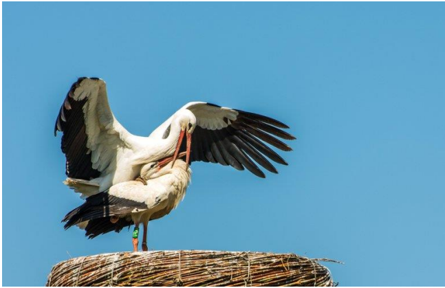
Parende ooievaars op het nest. Pa ongeringd, Ma geringd en afkomstig uit Frankrijk.