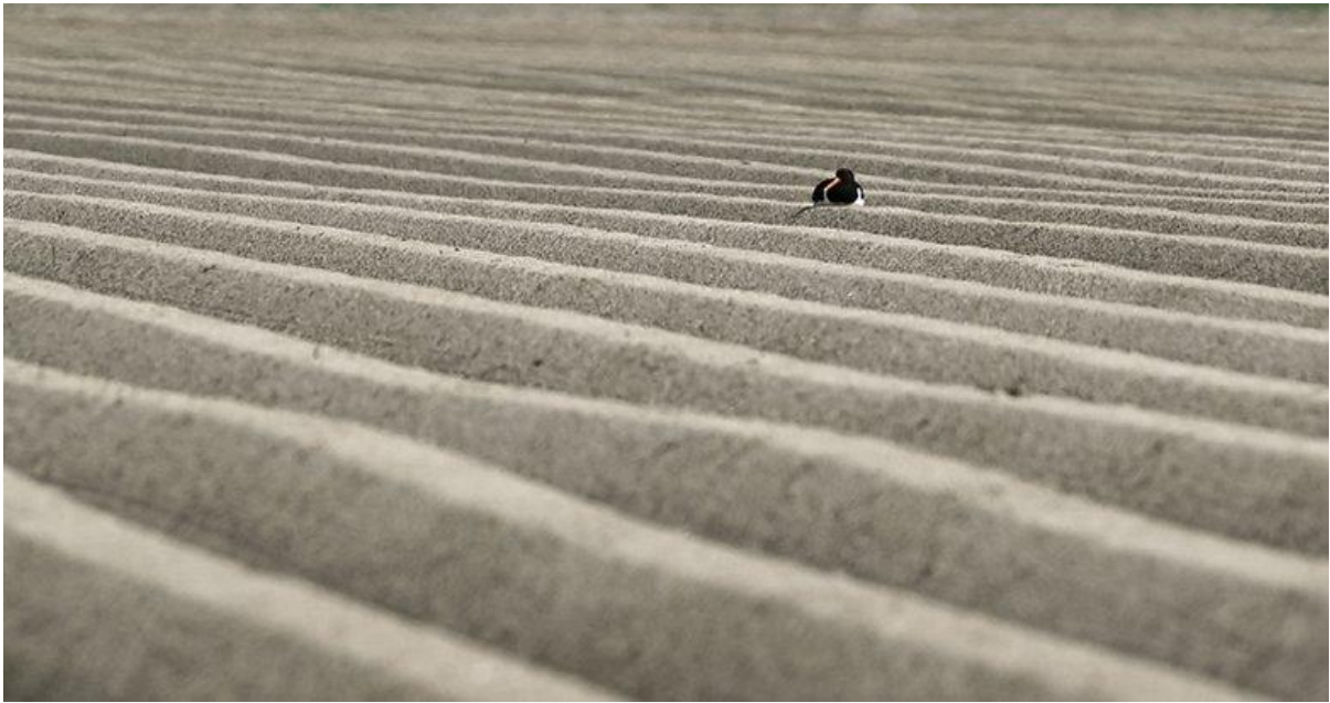
Scholekster broedend op grote akker zonder enige beschutting.