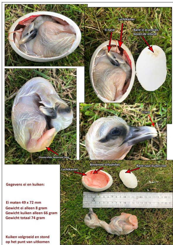
Foto Leo: Collage van het dode ongeboren jong in het enige verlaten ei wat op het nest lag.

Excuses voor het wat lange verhaal, maar ik kon het niet korter verwoorden helaas.