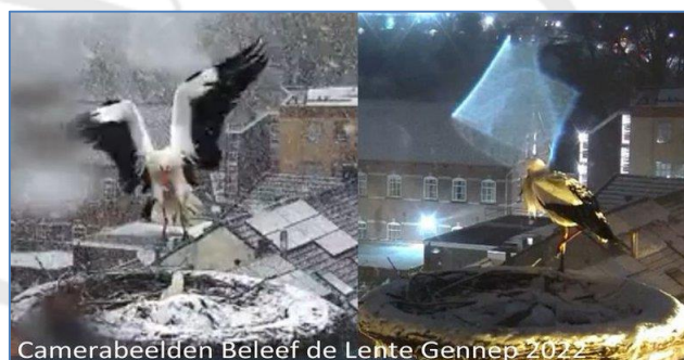
Camerabeelden Beleef de Lente Gennep 2022

Terug naar de ooievaars in de sneeuw. In januari heeft STORK de jaarlijkse wintertelling uitgevoerd met de hulp van heel veel melders uit het hele land. Het werd weer een groot succes. Wilt u meer lezen over de resultaten van deze telling, kijk dan bij Wintertelling 2022 .