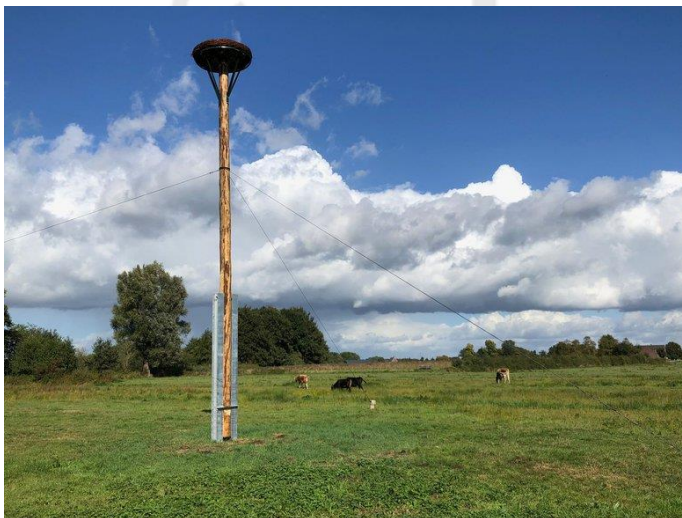
De Vilt in Beugen. Prachtige omgeving, rust en mooie ligging, wie wil zo'n nest nu niet ?

Gevechten tussen ooievaars zijn aan de orde van de dag, een gewild nest zoals in Gennep, maar ook andere nesten zijn erg in trek en wie wil daar nou niet zijn jongen groot brengen?