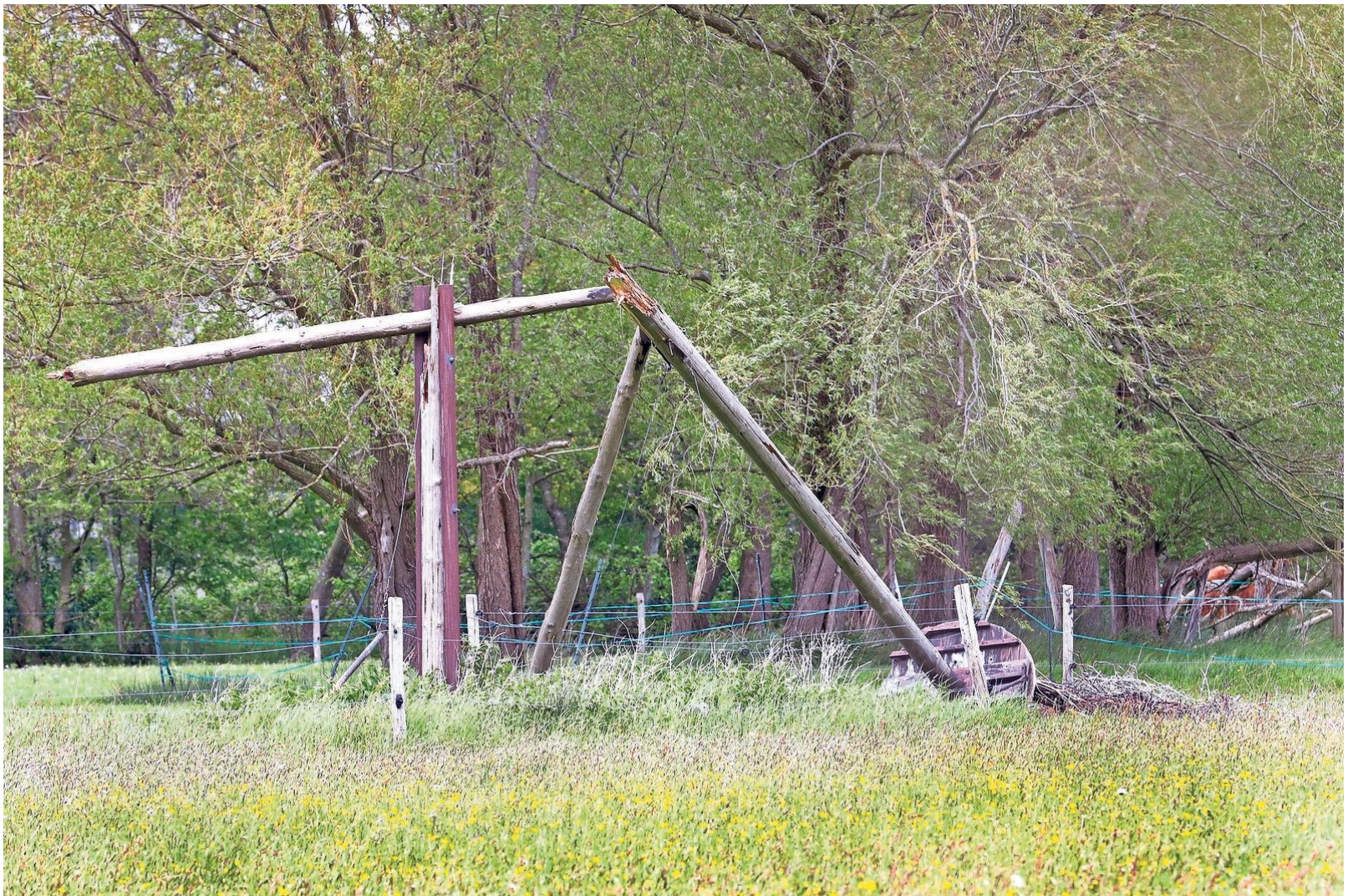
Het in de storm afgeknapte nestplateau. Het ooievaarsnest ligt er naast op de grond.

Het ooievaarspaar dat jaarlijks Santpoort-Zuid aandoet om er te broeden, zit in verwarring te kleppen op het dak van hoeve Middenduin. Even verderop in het weiland liggen de resten van hun nest. Vrijdagmiddag is het nestplateau waarop dat lag, afgebroken en met nest en al naar beneden gestort. Twee ooievaarsjongen hebben dat niet overleefd. „Ik ben er helemaal verdrietig van”, zegt Marianne de Boer, de eigenares van het plateau.